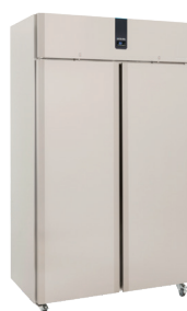
ES 1400 SHS ES 1400 SLS