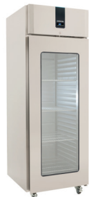
ES 650 SGS